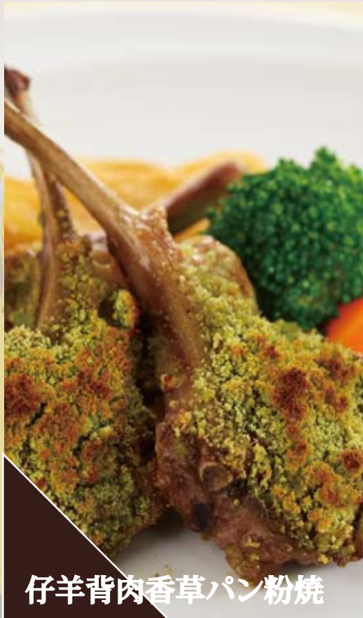
仔羊背肉香草パン粉焼