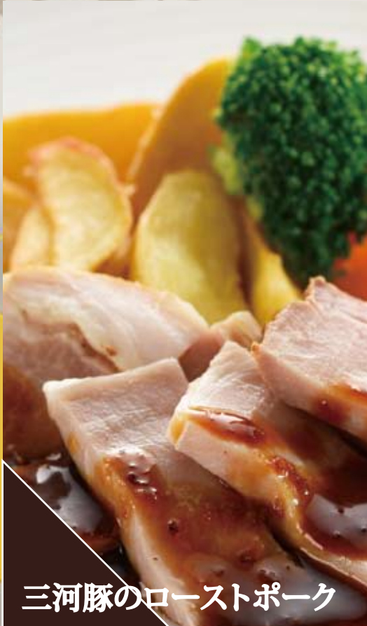
三河豚のローストポーク